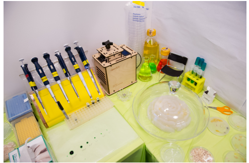
Biofabricate 2014

Der größte Vorteil ist natürlich das gesammelte Wissen der Mitglieder, mit dessen Hilfe es ermöglicht wird die eigenen Ideen umzusetzen, Erfahrungen auszutauschen, und andere bei deren Projekten zu unterstützen.