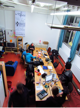
Table of glory, RaumZeitLabor

Daneben freuen wir uns natürlich über Spenden, egal ob monetär oder in Form von funktionstüchtiger oder reparierbarer Hardware bzw. Maschinen.