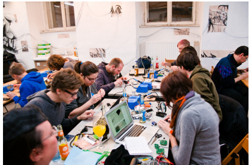
Workshop at Metalab, ©Mitch Altman, CC-BY-SA-2.0

Die derzeit nächstgelegenen Spaces sind in Wien (z.B. metalab), Linz, und Graz. In St. Pölten arbeitet derzeit ein Verein daran ebenfalls etwas aufzubauen. Aber im südlichen Niederösterreich bzw. Burgenland gab es bisher nichts. Das wollen wir ändern, indem wir einen Trägerverein gegründet haben, und jetzt auf der Suche nach motivierten Mitgliedern und Räumlichkeiten sind.